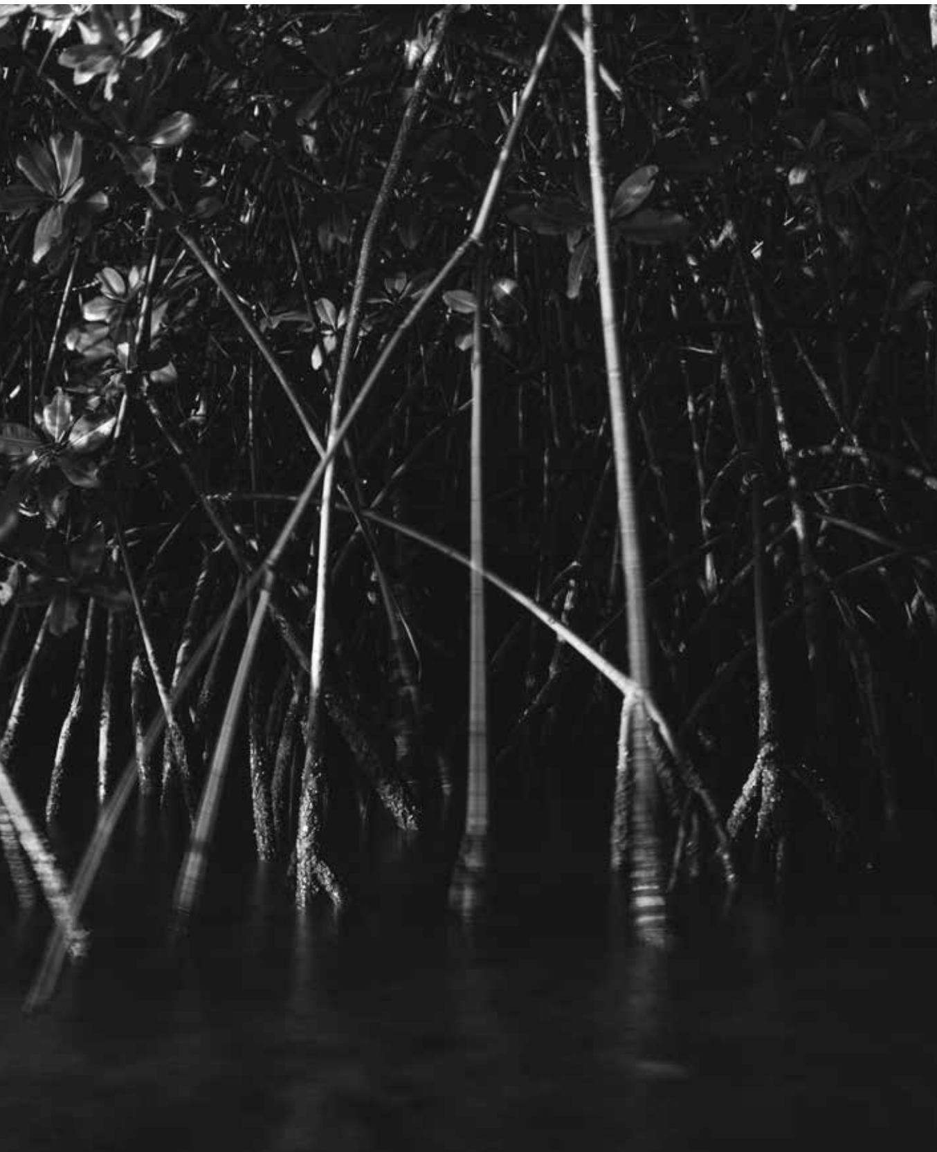
Nicolas Derné, sans titre, série « je ne nierai point », 100 x 150 cm