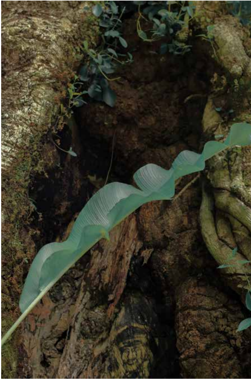
Xuebing Du, Home to a distant heart , 60 x 40 cm