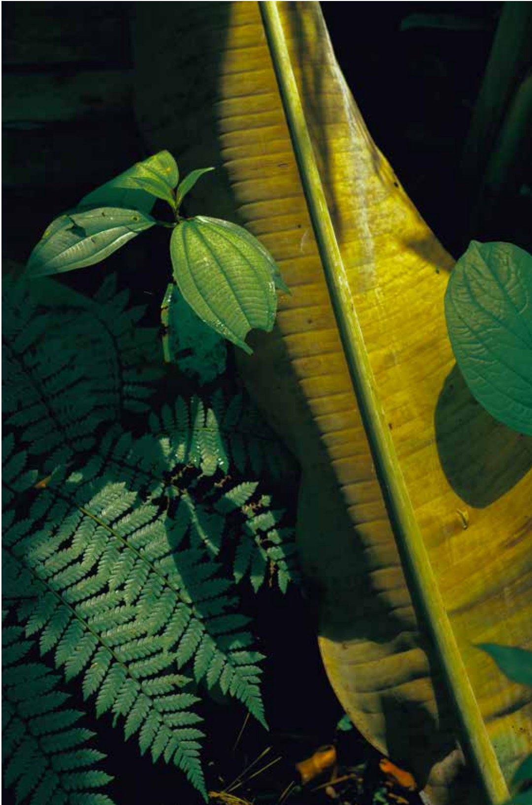
Xuebing Du, Home to a distant heart 180 x 120 cm