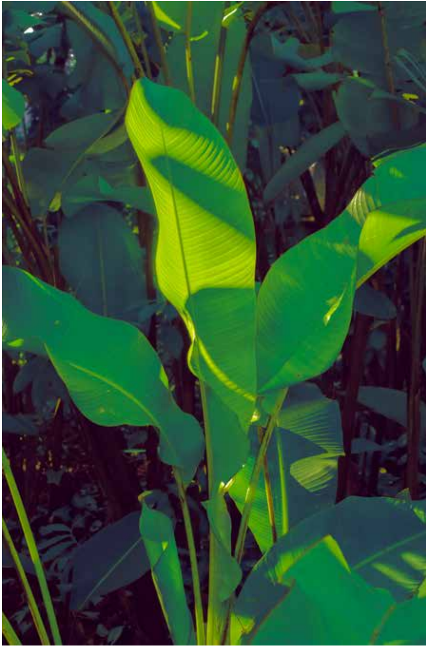
Xuebing Du, Home to a distant heart 180 x 120 cm