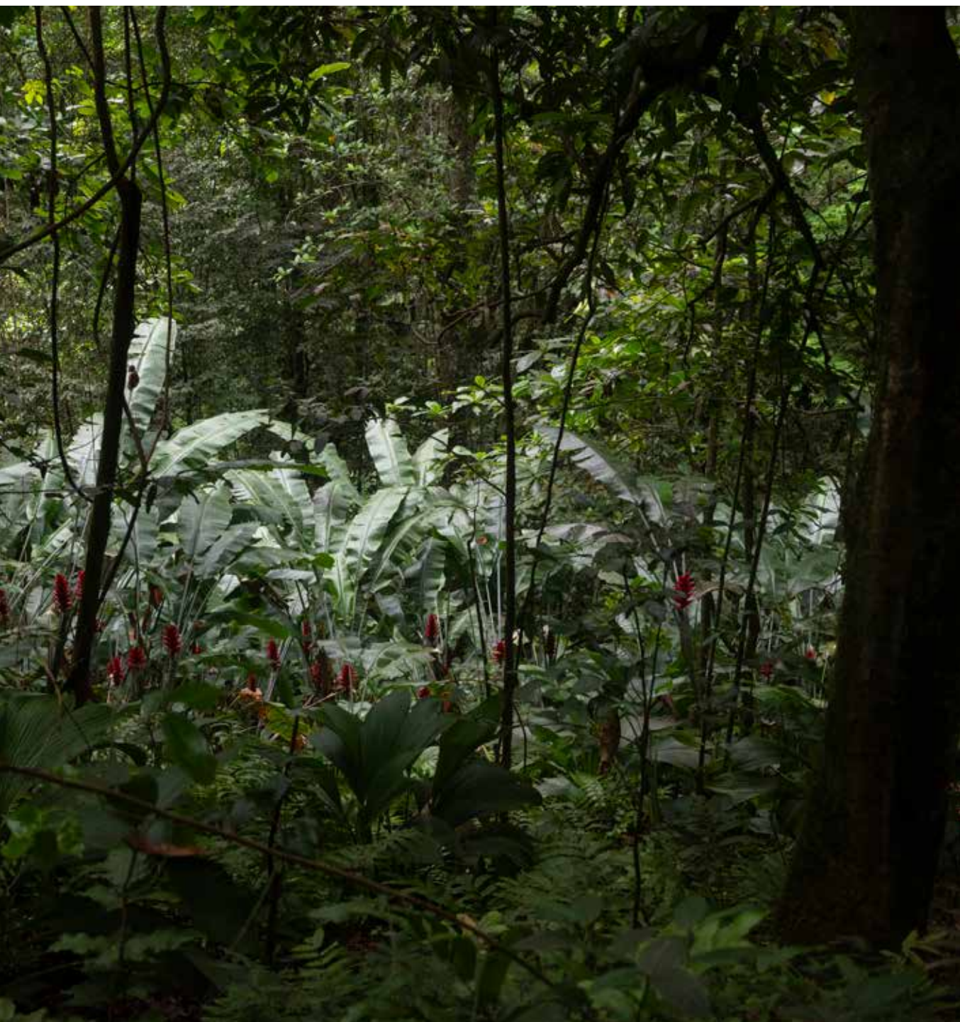
Juliette Agnel, Forêt-ancêtres , 160 x 120 cm