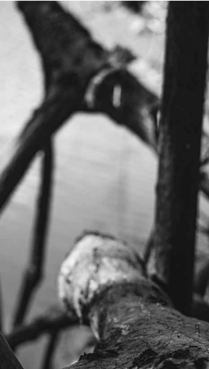
Nicolas Derné, sans titre, série « je ne nierai point », 120 x 180 cm