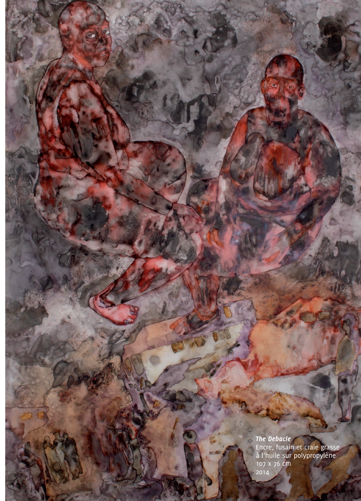
The Debacle Encre, fusain et craie grasse à l'huile sur polypropylène 107 x 76 cm 2014