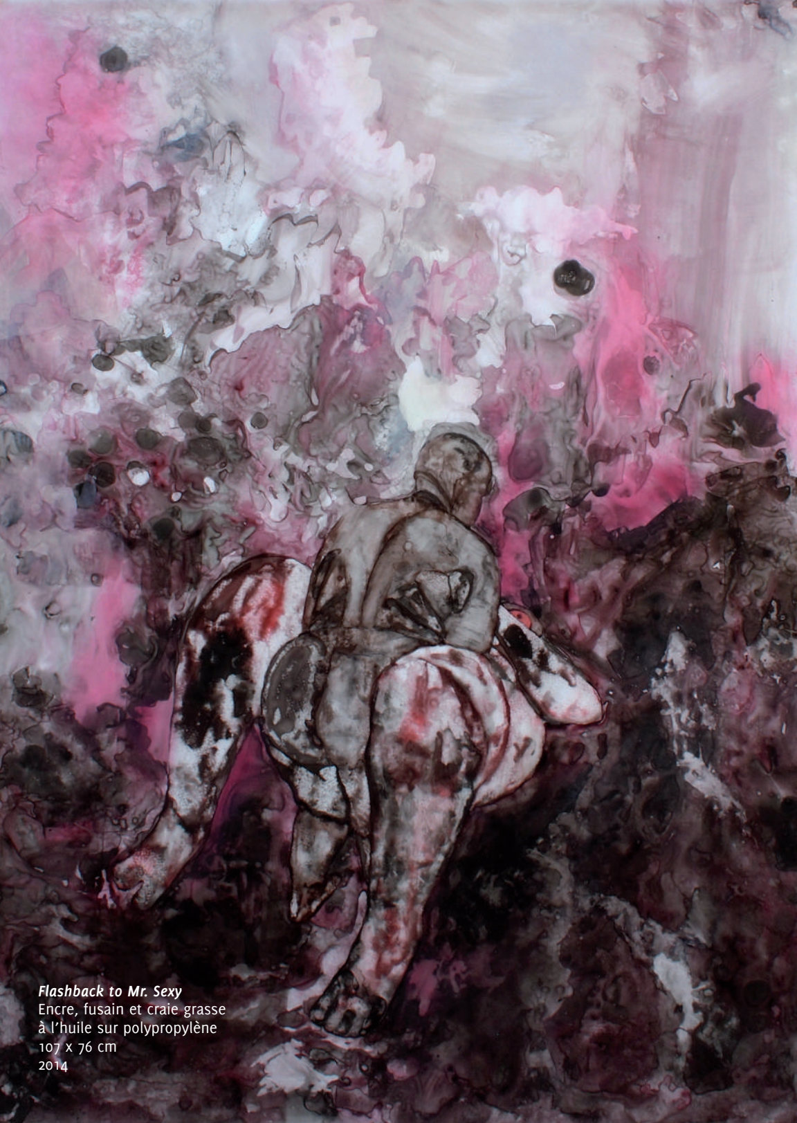
Flashback to Mr. Sexy Encre, fusain et craie grasse à l'huile sur polypropylène 107 x 76 cm 2014