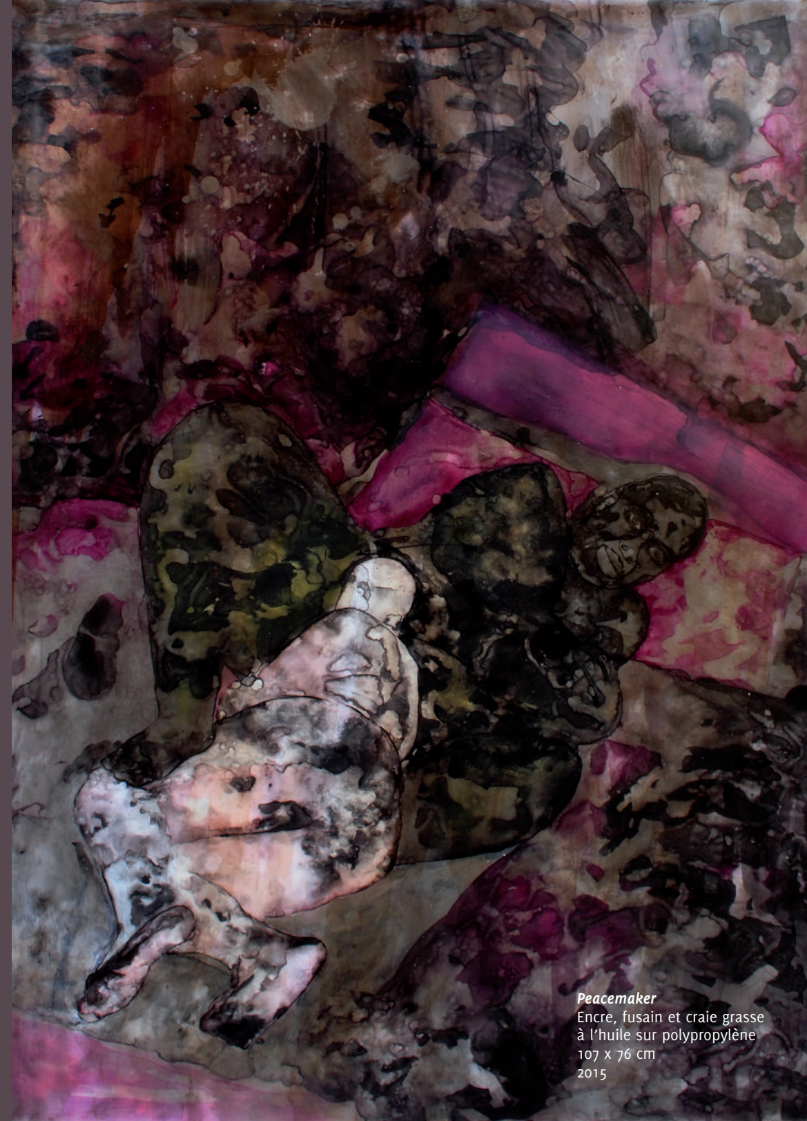
Peacemaker Encre, fusain et craie grasse à l'huile sur polypropylène 107 x 76 cm 2015