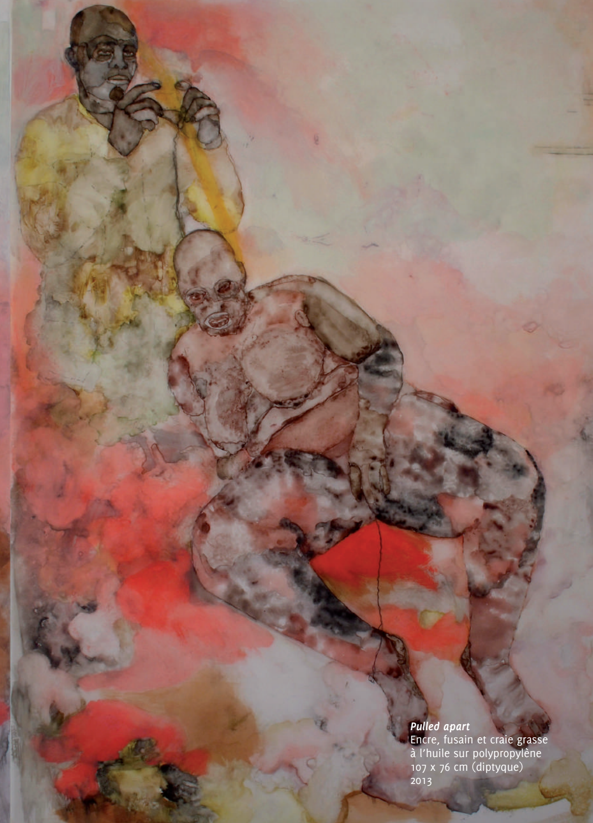
Pulled apart Encre, fusain et craie grasse à l'huile sur polypropylène 107 x 76 cm (diptyque) 2013